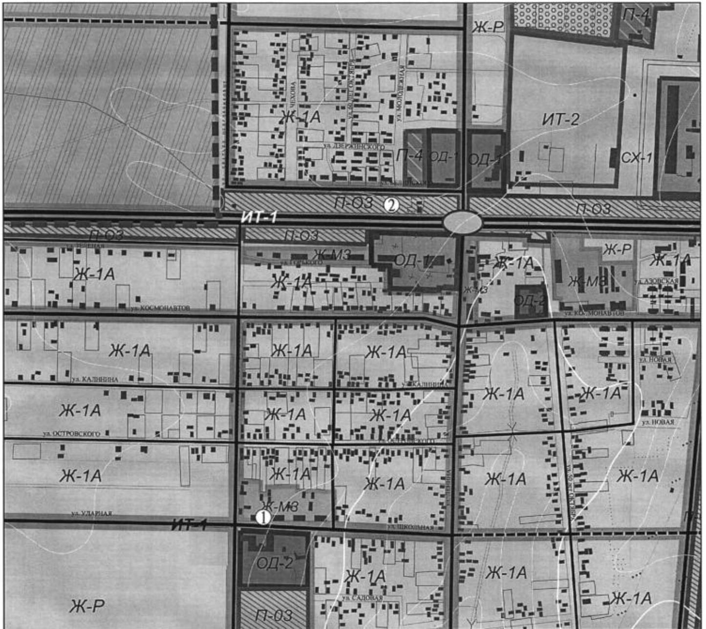
Схема расположения нестационарных торговых объектов на территории Ахтарского сельского поселения п. Ахтарский