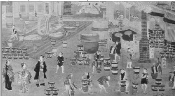
Транспортировка соевого соуса

Сначала сёу делали в монастырях, но позже его стали производить и фермеры. Расцвет производства соевого соуса начался в XVI веке в регионе Кансай, который в то время был центром культуры в Японии.