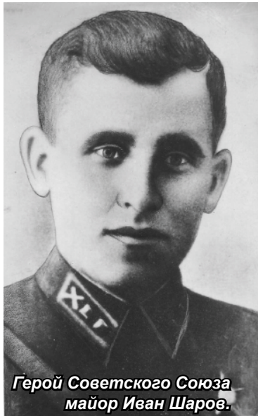
Герой Советского Союза майор Иван Шаров.