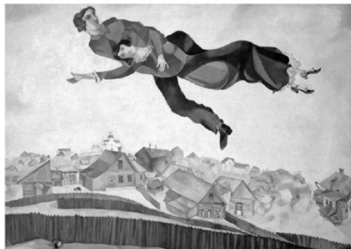
Марк Шагал. «Над городом», 1918 год, Государственная Третьяковская галерея, Москва