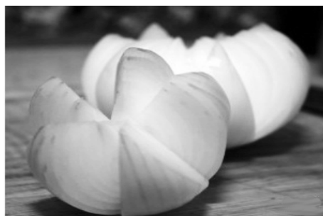
Оптимальное количество лепестков - 5

Первым делом очищаем лук. Очень важно не отрезать корень лука слишком глубоко - благодаря нему наша луковая роза не развалится при обжаривании. Если же срезать корень слишком глубоко, лук развалится. Под острым углом делаем надрезы на нашей луковице, формируя лепестки. Для наглядности смотрите на фото.