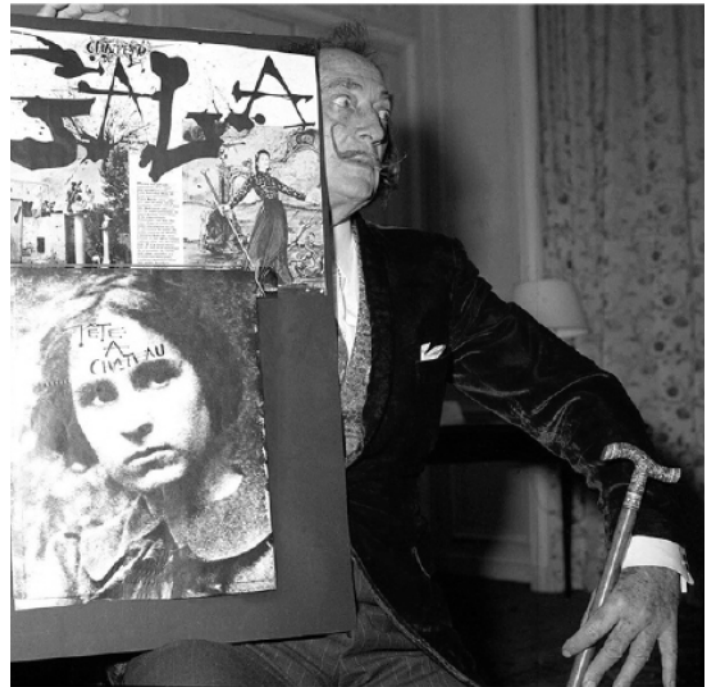
Сальвадор Дали в отеле Le Meurice, Париж, 1972 год

Для Сальвадора Дали любимая Галя стала не просто женой и музой, она превратилась в личного продюсера и привела его к бешеному коммерческому успеху. Даже свой дневник Дали посвятил ей: «Моей победоносной Гале Градиве, моей Елене Троянской, моей святой Елене, моей блистательной, как морская гладь, Гале Галатее безмятежной».