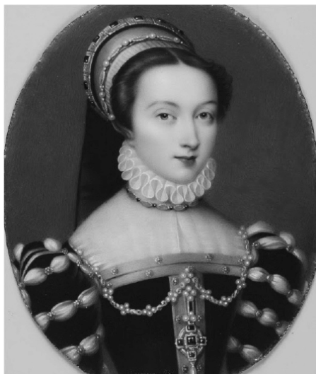
Мария Стюарт— королева Шотландии, а также королева Франции в 1559—1560 годах (как супруга короля Франциска II) и претендентка на английский престол.

Больше всех мармелад любят англичане. В каждой второй британской семье за завтраком подается поджаренный тост с апельсиновым мармеладом. Говорят, что этот сорт лакомства изобрел личный врач шотландской королевы Марии. Королева страдала от морской болезни и потеряла аппетит. Лекарь давал ее величеству апельсиновые дольки с кожурой, посыпанные мелким сахаром, а также готовил сладкий отвар из айвы и цитрусовых. Вкусное лекарство так полюбилось королеве, что по ее указу десерт постоянно держали на прикроватном столике. А поскольку врач королевы был французом, считалось, что само слово «мармелад» произошло от его фразы «Marieestmalade» (Мария больна).