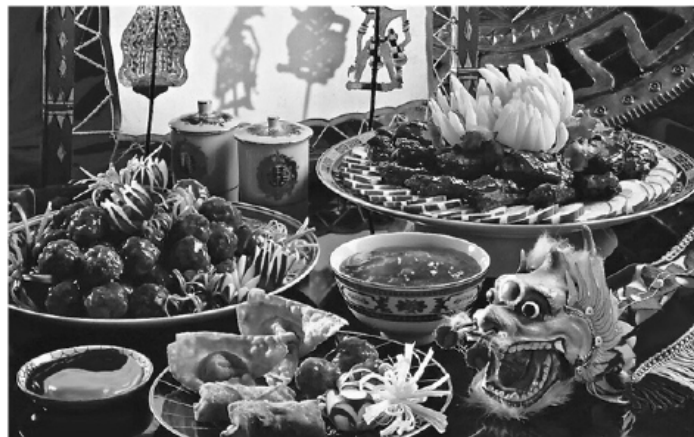
Новогоднее застолье в Китае.

Корни этой страсти берут начало в древней традиции.