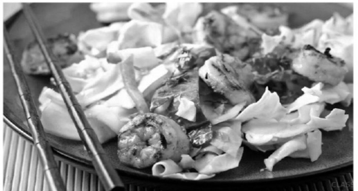
Закуска из королевских креветок и пекинской капусты.

Обязательно выберете рецепт по-вкусу и приготовьте его для себя и своих близких.