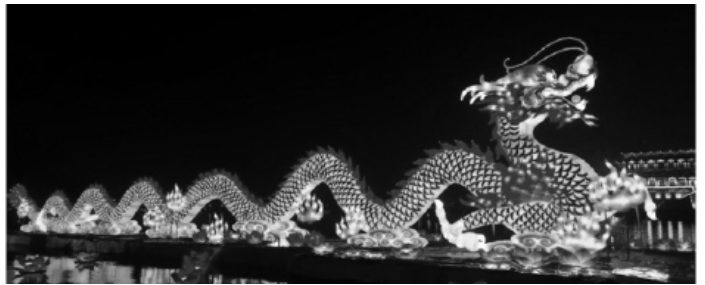
Китайское чудовище Ниан.

Празднуют китайцы бурно. Про любовь жителей Поднебесной к фейерверкам знает весь мир. Китайцы готовы тратить на это развлечения огромные средства.