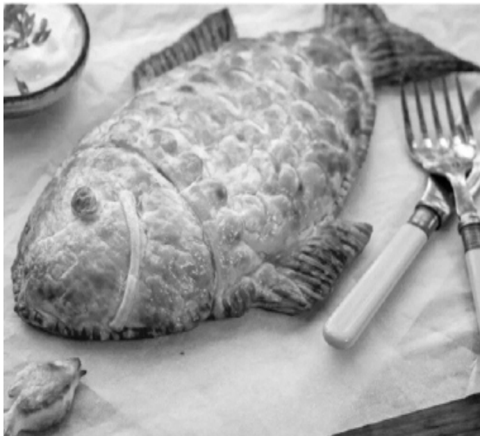
Кулебяка рыбная из сдобного теста.