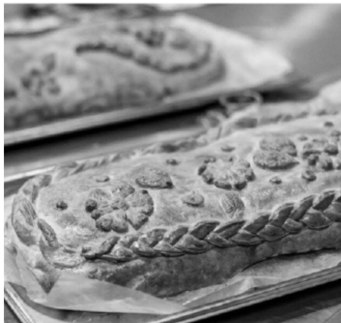
Кулебяка, украшенная фигурками из теста.

Звание "Царская еда" кулебяка получила благодаря московским трактирщикам. Они готовили такие «вавилон», что их заказывали даже к царскому столу и доставляли в Петербург специальными обозами.