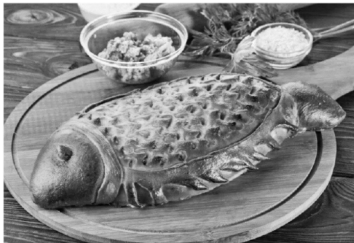
Кулебяка с рыбной и мясной начинкой.

Кулебяка с красной и белой рыбой, припущенной в соусах, нежными блинчиками и аппетитными добавками. Настоящий царский рецепт. Русский шик для вашего праздничного стола.