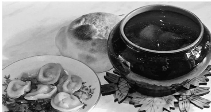
Город Благовещенск. Забайкальский край.

В общем, задание редакции было полностью выполнено. Руководство от полученного материала пришло в восторг. Из чего следует, что все испытания, выпавшие на голову молодого и пытливого корреспондента, были не напрасны.