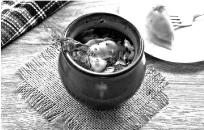
Пельмени "Амур" с соусом из печени и сметаны.

Рецепт и история. С лирическими отступлениями. Короче, все запутано и непросто. Но очень вкусно!