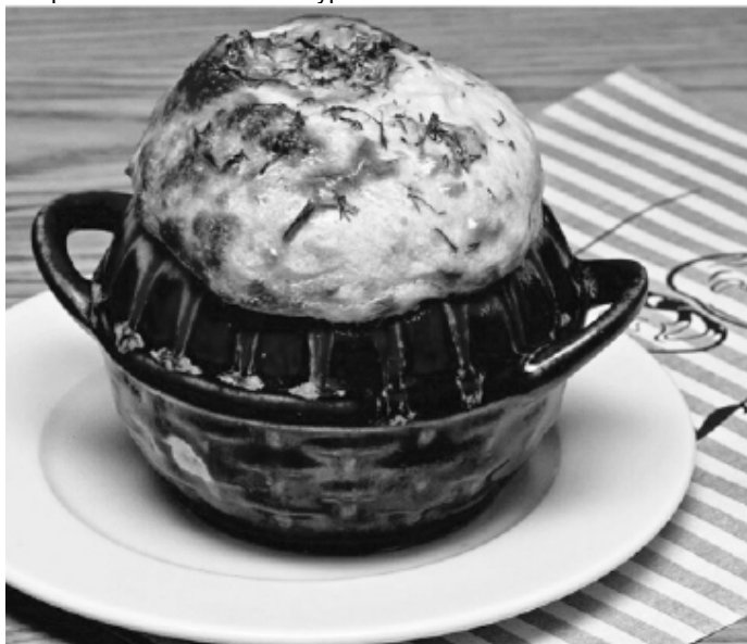
Пельмени "Амуры" в горшочках.

И только для него местные повара с огромной любовью готовят горшочек пельменей "Амур".