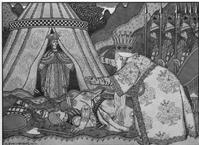
Иллюстрация Ивана Билибина к сказке Александра Пушкина

Однако в пушкинистике до сих пор ведутся споры об источниках некоторых пушкинских сказочных произведений, которыми могли послужить не только рассказы няни, но и европейские легенды и сказки, прочитанные поэтом.