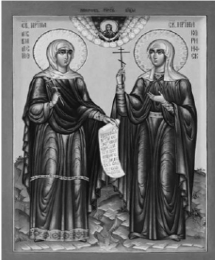
Святые Ирина Аквилейская и Ирина Коринфская

При крещении будущей няне Александра Пушкина дали имя Ирина (Иринья), именины которой приходились на 16 апреля, когда отмечается память двух святых с этим именем – Ирины Аквилейской и Ирины Коринфской. Ирина было домашним, разговорным, именем. Спорные вопросы вызывает и фамилия Ирины Родионовны. Часто в литературе ей приписывают фамилию Яковлева (так как отца Арины звали Родион Яковлев). Однако во всех документах (ревизских сказках, метрических церковных книгах и пр.) она названа Родионовой. Выйдя замуж, Ирина стала Матвеевой. Однако в историю русской литературы Ирина Яковлева-Родионова-Матвеева вошла без фамилии – просто Ирина Родионова.